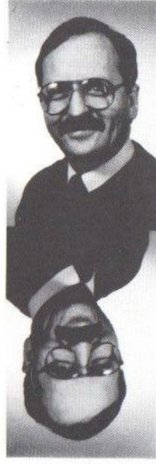
Mr. OPS ASSIST